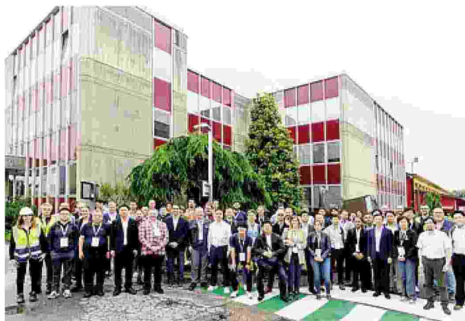
Porte aperte a Osnago